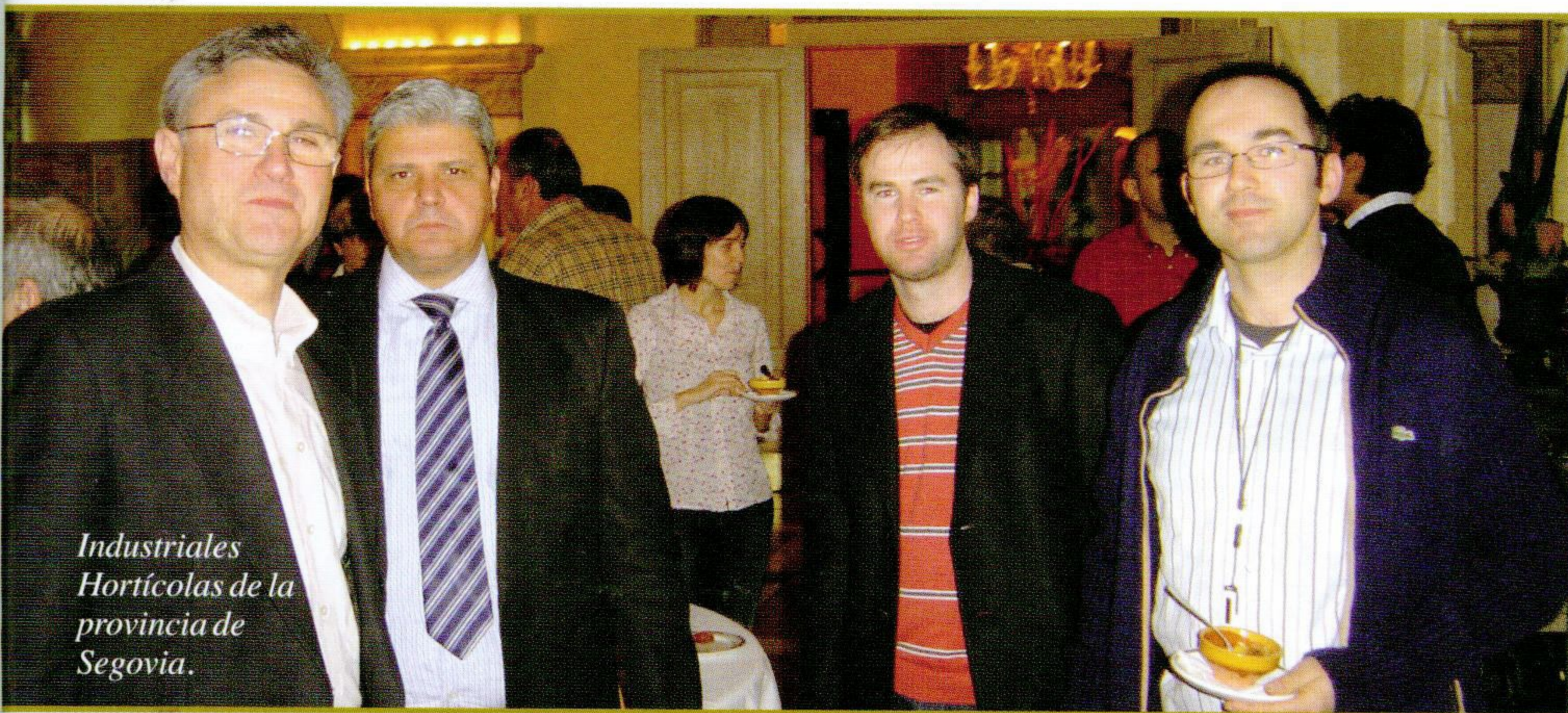
Industriales Hortícolas de la provincia de Segovia.