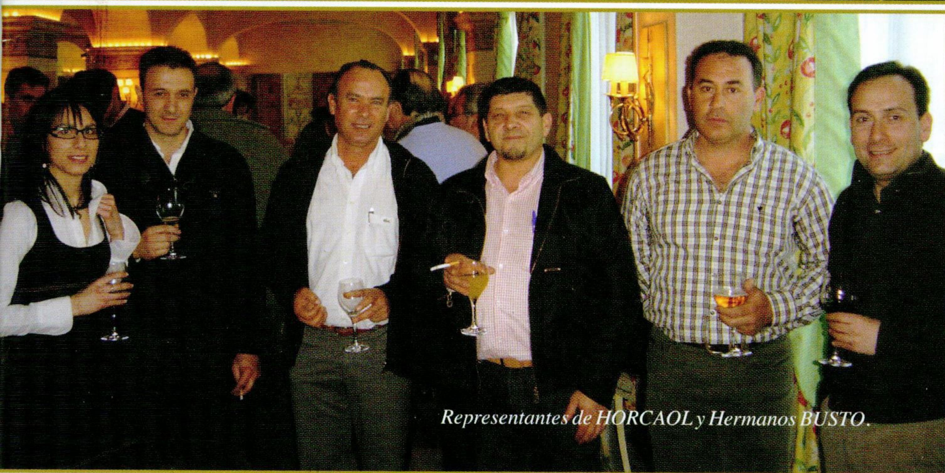
Representantes de HORCAOL y Hermanos BUSTO.