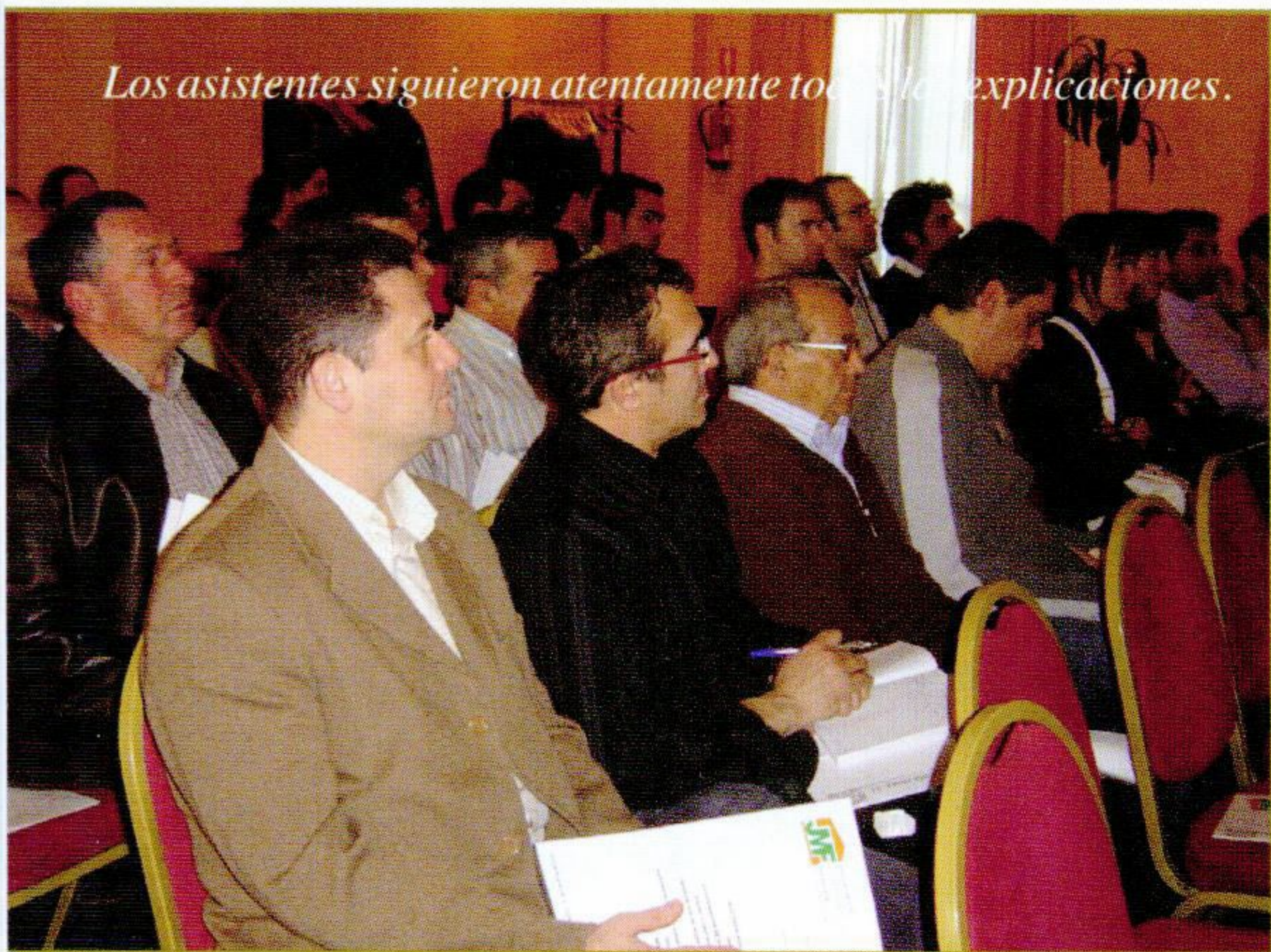
Los asistentes siguieron atentamente todas las explicaciones.

Prevención Ambiental de Castilla y León. En la solicitud hay que poner el nombre y apellidos del interesado y en su caso el nombre de la persona que lo represente así como el lugar a efecto de las notificaciones junto con el número de DNI. También los hechos o descripción de la actividad que se va a desarrollar, el lugar, fecha, firma y a quien se dirige, que será el alcalde del municipio donde estará la instalación.